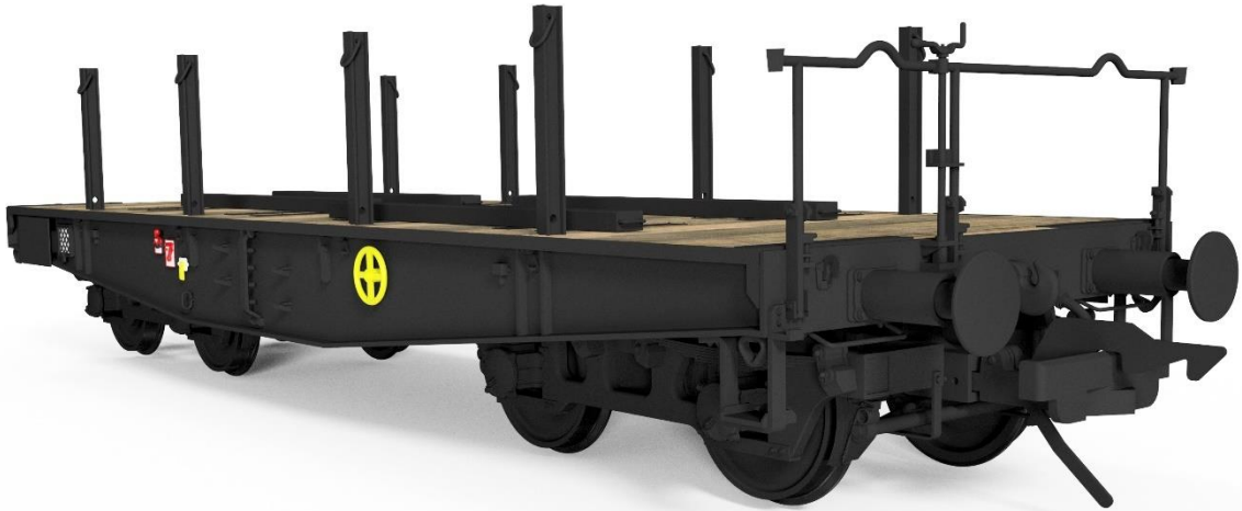
Bild aus der 3D-Konstruktion

Diese Schwerlastwagen wurden als Panzertransportwagen entwickelt. Später wurden alle Arten von schweren Lasten mit ihnen transportiert. Diese recht kurzen Fahrzeuge in zeitgemäßer Ausführung können auf allen Modellbahnanlagen eingesetzt werden.