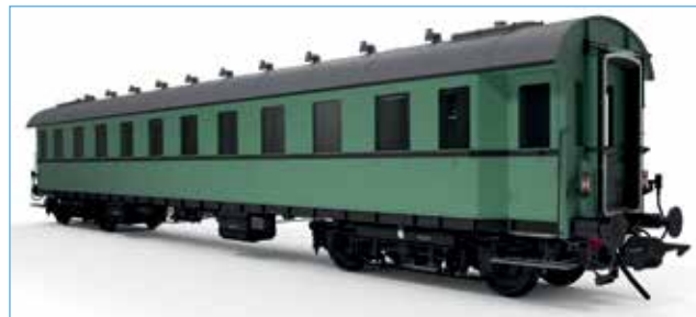
41251-03 3D-Zeichnung aus der Konstruktion