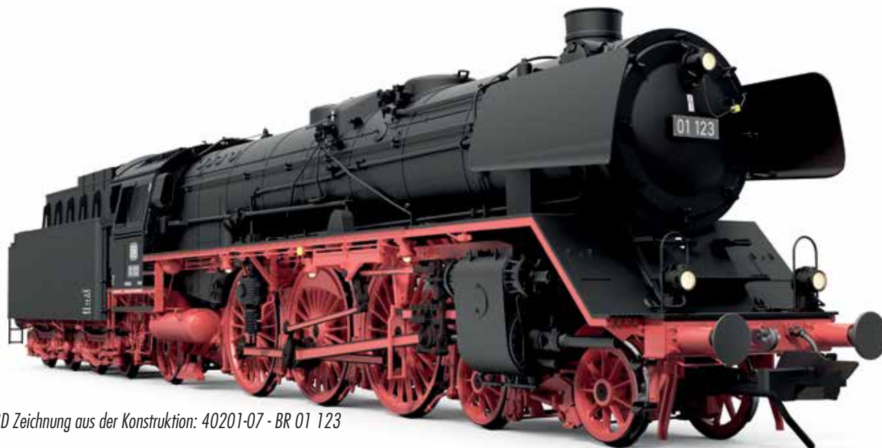
3D Zeichnung aus der Konstruktion: 40201-07 - BR 01 123