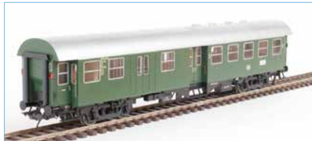
41230-04 Bild: Vorgängermodell