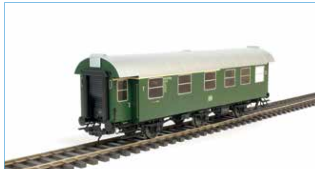
41240-05 Bild: Vorgängermodell